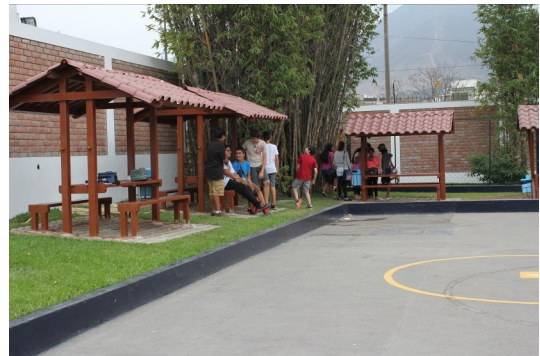
Installation de 6 tables de pique-nique dans la cour du collège et sur le terrain du primaire