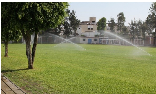
Maintenance du terrain de football du secondaire