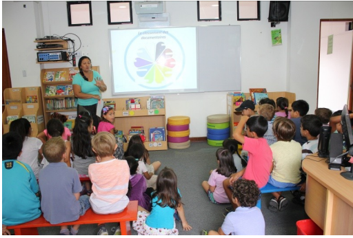
Installation d'un tableau interactif à la BCD