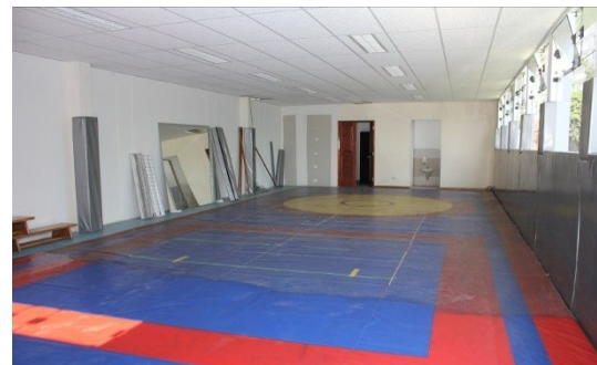
Maintenance générale de tout l'établissement