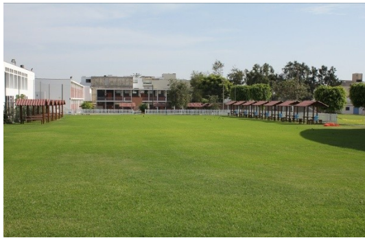
Maintenance du terrain de football du primaire