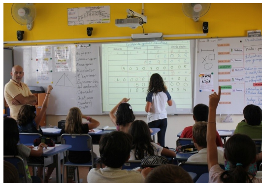
Installation des tableaux interactifs pour les classes de CP-CM1-CM2