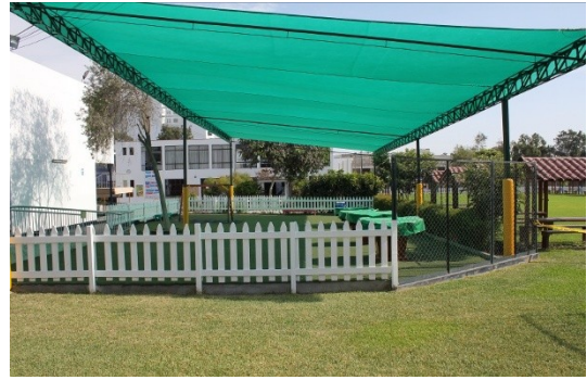
Installation d'une protection solaire sur l'aire de jeu du primaire