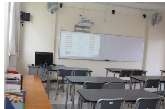
Installation d'un tableau interactif dans la salle de permanence du primaire